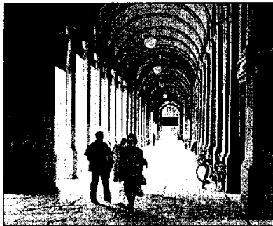
Tante iniziative in programma alla Fiera biennale di Lugo

dunque sul palcoscenico i Resemblance e Jolly Roger mentre domani sarà la volta di altri gruppi come i Full Energy, gli One More Fear ed infine Assmonkey. «Con questa piccola rassegna musicale - sottolineano gli stessi promotori delle iniziative in programma a Lugo - vogliamo offrire ai giovani musicisti un'opportunità per esibirsi e, allo stesso tempo, creare un'occasione di svago per i ragazzi lughesi e per i giovani provenienti da tutta Europa che in questi giorni parteciperanno al torneo di pallavolo organizzato nell'ambito della manifestazione Lugo Città d'Europa promossa dalla Pro Loco». Il settimo torneo internazionale di pallavolo "F. Battaglia, Cracovia e Sevnica" sarà infatti uno dei principali appuntamenti di queste giornate e vedrà partecipare le formazioni di