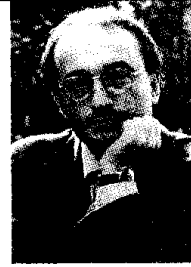
Sindaco di Lugo

Un'estate "movimentata", nel racconto del sindaco Maurizio Roi