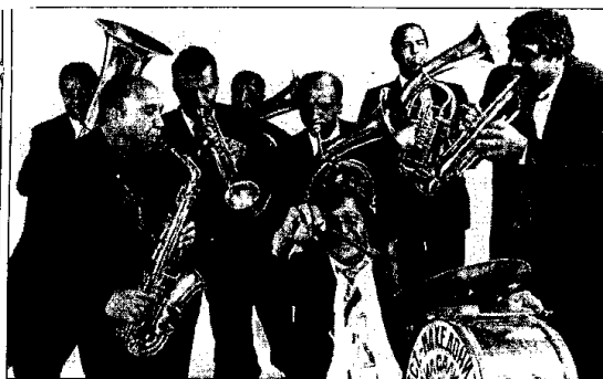
La Kocani Orkestar

LUGO - Prosegue il programma degli spettacoli compresi nel cartellone della rassegna di Pavaglione Estate. Questa sera, con inizio alle ore 21.15, a salire sul palco del Chiostro del Monte di Lugo sarà la Kocani Orkestar - Gipsy Brass Band con la sua musica tzigana suonata con sassofoni, trombe, clarinetti e percussioni. La Kocani