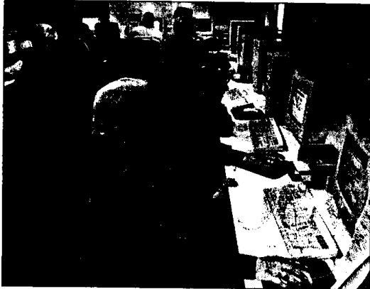
I soci dell'Università per Adulti seguono con estrema attenzione le lezioni di informatica impartite dai giovani liceali lughesi.