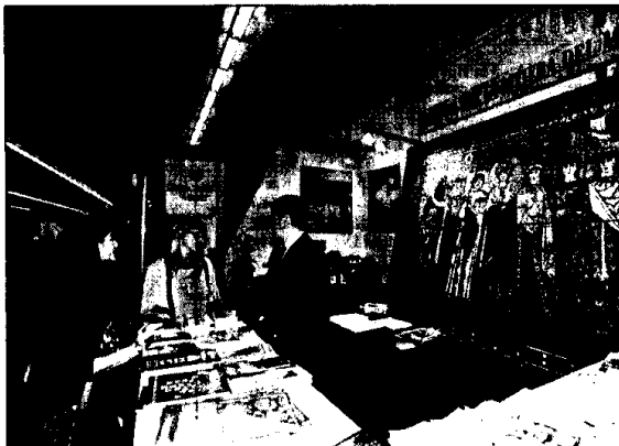
Fino a domenica prossima alla Borsa internazionale del turismo di Milano nello stand dell'Emilia-Romagna saranno presentate le attività del 'Rossini'.

rappresenta una percentuale significativa dei flussi turistici in Italia». In questa direzione il teatro Rossini si sta muovendo sfruttando anche le possibilità di comunicazione offerte da Internet. Da alcuni mesi infatti è attiva la biglietteria on-line che consente di acquistare biglietti tramite Internet partendo dal sito della ditta Leoni ( www.leonidaniele.it ) oppure entrando nel sito Racine del teatro Rossini ( www.racine.ra.it/lugo/teatro ) visualizzando i posti disponibili direttamente sulla pagina, come al botteghino, e utilizzando la procedura 'best seat' per la ricerca automatica del posto migliore. Tra pochi mesi poi sarà ultimato il sito Internet del teatro Rossini che offrirà informazioni sulla storia del teatro e sui programmi invernali ed estivi; vi saranno anche informazioni turistiche su Lugo, con riferimento ad alberghi e ristoranti.