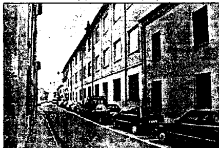
La Giunta comunale ha deciso una serie di interventi sulle strade

Partendo proprio dal centro storico gli interventi più consistenti riguarderanno corso Matteotti, viale Rossini, via Cardinal Massaia e via Manfredi, strade in par-