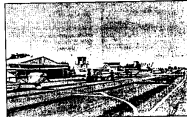
L'aeroporto di Villa San Martino che è ora prevalentemente destinato agli aerei leggeri

Dai Verdi giunge anche un messaggio di solidarietà ai residenti che da anni protestano contro l'inquinamento acustico provocato dalle attività aeroportuali (voli acrobatici ed esercitazione degli elicotteri) e dal vicino tiro al piattello. Preoccupati per la salute e la qualità della vita dei residenti, i Verdi lughesi chiedono, ai due Comuni entrati nella nuova società di gestione, le più ampie garanzie a lo-