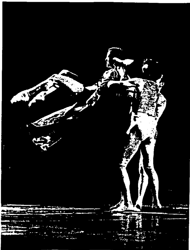
Aterballetto, «Furia Corporis»