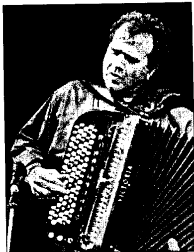
Il musicista francese Richard Galliano

Ha fuso il genere "musette" con il jazz, il tango e la tradizione mediterranea