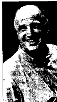
vicino di casa. E non vogliamo allora parlare dell'ingresso dell'Italia in Europa? Infine, ed era inevitabile, si ragionerà e riderà sulla morte. Nelle foto: in alto Moni Ovadia; in basso Paolo Hendel.

Al Comunale di Conselice invece sarà di scena il comico conosciuto da tutti come Carlo Pravettoni: infatti alle 21 è in programma 'Il meglio di Paolo Hendel', uno spettacolo antologico che ogni sera cambia e si aggiorna a seconda dell'umore dell'irriverente e dissacrante comico. In pratica è una sintesi aggiornata del meglio dei suoi monologhi di questi ultimi anni, a cominciare naturalmente da Pravettoni, il mitico genio della finanza nato nella trasmissione televisiva 'Mai dire gol'. Gli spettatori potranno così riflettere sulle problematiche riguardanti la sovrappopolazione e il controllo delle nascite con tanto di slogan pubblicitari dei profilattici. E poi si parlerà, e si riderà, sull'evoluzione del genere umano, dall' Homo semipiegatus all' Homo erectus , sul fenomeno della deriva dei continenti e sul tema del razzismo conseguenza dello spostamento dell'Africa verso l'Europa, con il Canton Ticino che si trova il Marocco quale