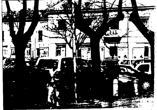
Situazione critica per la salute delle piante anche in piazza Garibaldi, dove sarà necessario abbattere alcuni alberi.

lattia si possono spezzare all'improvviso. In genere si tratta di problemi che hanno avuto origine da trattamenti sbagliati, come la capitozzatura, che si eseguivano molti anni fa quando la sensibilità nei confronti del verde era meno sviluppata rispetto ad oggi». Situazioni critiche si sono riscontrate, sempre nel centro città, in viale Taroni e in piazza Garibaldi. Anche in questo caso di deciderà volta per volta se togliere gli alberi e piantarne altri o se procedere all'abbattimento di alcune piante. «Tutti gli interventi — conclude Micela — saranno comunque realizzati cercando di prestare maggiore attenzione alla sicurezza dei cittadini e alla salute del verde pubblico. In ogni caso non diminuirà il verde lungo le strade di Lugo. Le piante abbattute perché ammalate e pericolose verranno comunque sostituite».