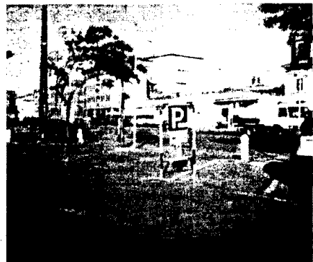
Parcheggio Piazza Garibaldi