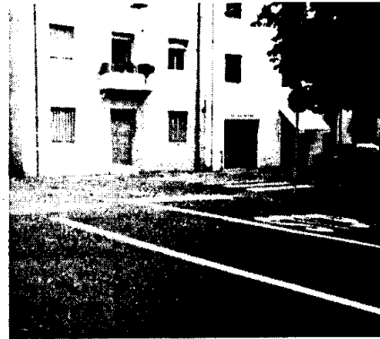
incrocio Via Baracca Viale Orsini