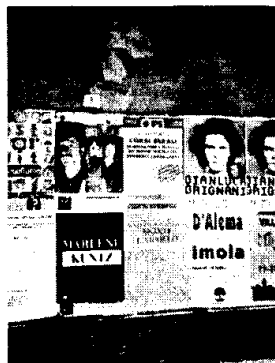
Via Amendola n. 8