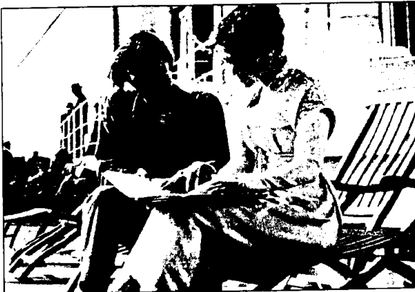
Per «Titanic» di Cameron, repliche a raffica nelle rassegne estive

BAGNACAVALLLO. All'Arena delle Cappuccine prosegue il cinema: 23/7 «Posta celere»; 24/7 «Sesso e potere»; 25/7 «Il grande Lebowski»; 26/7 «Sette anni in Tibet»; 27/7 «In cerca di Amy»; 28/7 «Scream»; 29/7 «La comare secca»; 30/7 «Aprile»; 31/7 «La casa del sì»; 1/8 «Tre uomini e una gamba»; 2/8 «In&Out»; 3/8 «Cosmos»; 4/8 «Donnie Brasco»; 5/8 «Will Hunting Genio Ribelle»; 6/8 «Ragazze»; 7/8 «L.A. Confi-