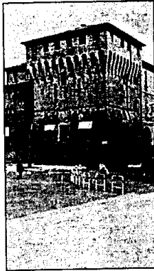
A lato, la Rocca sede dei locali che ospitano il municipio di Lugo

"Tutto quello che si crea come conseguenza dell'uso delle agevolazioni, mette in moto altri meccanismi che vivacizzano e accrescono lo sviluppo dei settori. Mettendo non più di tanto a disposizione di Romandiola 2000, l'amministrazione ha voluto