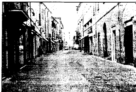
Una veduta di via Baracca in cui è sita la casa

l'esposizione dello Spad VII, l'aereo di Francesco Baracca, simbolo delle sue imprese aviatorie, di recente restaurato, ora l'Amministrazione Comunale intende valorizzare l'intero complesso edilizio risalente agli ultimi anni del 1800, recuperandolo a sede museale permanente. Il progetto complessivo, per una spesa di circa un miliardo, prevede il restauro e la ristrutturazione del corpo principale dell'edificio, dell'ala meridionale e settentrio-