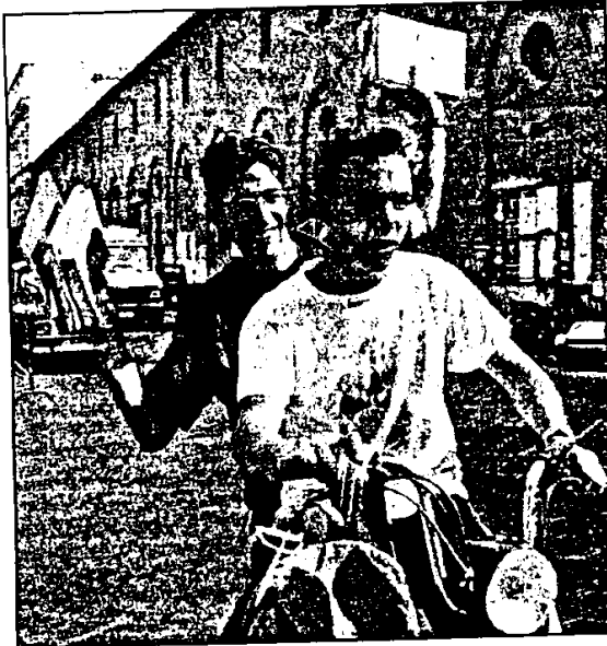
Nel capitolo riguardante "I luoghi dove crescere" troviamo il progetto del Centro giovani che prevede la realizzazione di una saletta per video proiezioni e videoconferenze,

Un dato che va raddoppiato se si considera il ruolo che la città di Lugo svolge come centro di servizi nel comprensorio: ruolo che l'Amministrazione intende sviluppare sempre più in futuro.