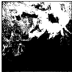
Claudio Neri, «Angelo ribelle»

Promossa dall'assessorato alla cultura del Comune di Lugo, dalla Banca di Romagna e dalla Fondazione Cassa di Risparmio, Banca del Monte di Lugo, curata da Aldo Savini e presentata in catalogo da Orlando Piraccini, la mostra antologica di Claudio Neri presenta una cinquantina di dipinti alle Pescherie della Rocca e una trentina di opere su carta a Casa Rossini. La mostra consente una lettura esauriente del percorso creativo dell'artista di oltre cinquanta anni di in-