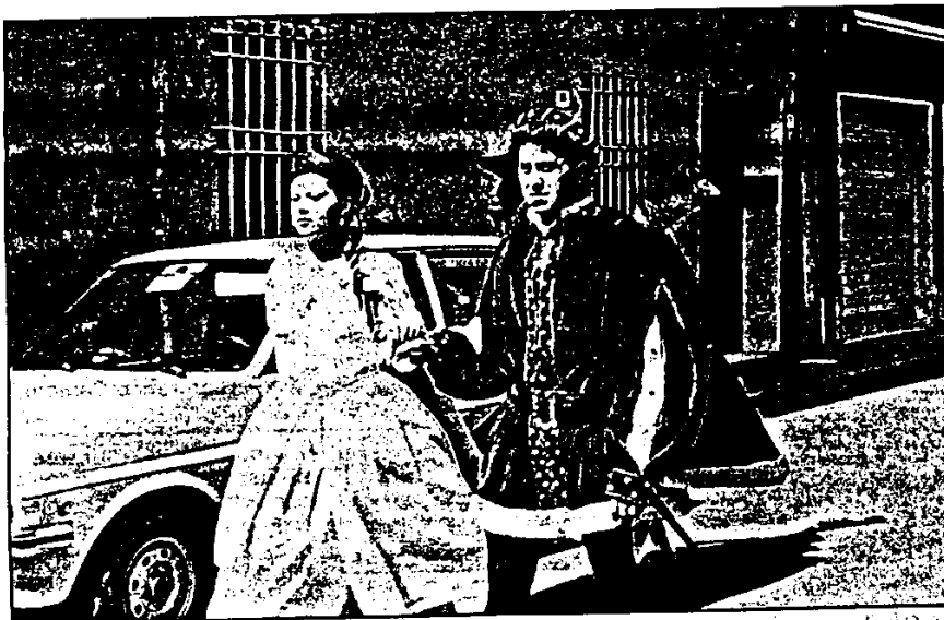
Un'immagine di repertorio di una sfilata dei "Signori di Cento"