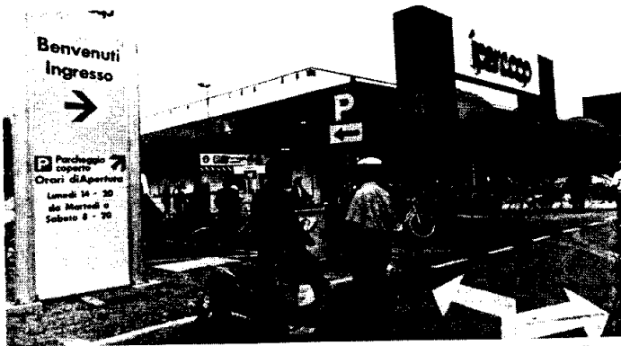
L'Ipercoop di Lugo sta registrando un grande afflusso di clienti.

«Il danno per noi negozianti di piccole dimensioni — afferma Marco, occupato nel ramo alimentare — soprattutto in questi primi giorni è enorme, come c'era poi da aspettarsi, vista la curiosità della gente di recarsi all'Iper. Ma per valutare esattamente l'influenza che avrà il nuovo 'gigante' sui piccoli commercianti oc-