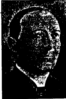
Don Carlo Cavina, Servo di Dio

La Superiora Generale ha così concluso: «Abbiamo deciso di realizzare questa opera perché siamo convinte della validità di questo servizio, richiesto oggi più che ieri. L'abbiamo intestata al nostro Fondatore perché è lui che ci ha trasmesso la dignità del servizio alla persona in qualsiasi stagione della vita e abbiamo scelto di realizzarla a Lugo perché lui, prima di noi,