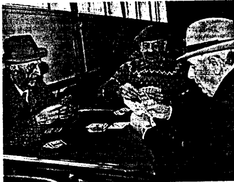
Il Comune manterrà comunque la competenza degli indirizzi programmatici

Restano di competenza dell'Amministrazione gli indirizzi programmatici, la finalità e i contenuti dell'assistenza domiciliare, gli orari di attuazione dell'attività di servizio, le prestazioni erogate e i criteri e le modalità per le ammissioni e le dimissioni degli utenti, i programmi di lavoro individuali in collaborazione con la ditta aggiudicataria; le rette da porre a carico degli utenti e dei familiari e la relativa riscossione. La ditta che vincerà la gara dovrà mettere a disposizione personale qualificato che sarà impegnato in diversi com-