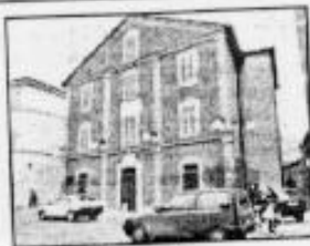
Il teatro Rossini